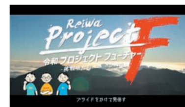
令和 プロジェクトフューチャー! フライドをかけて発信す