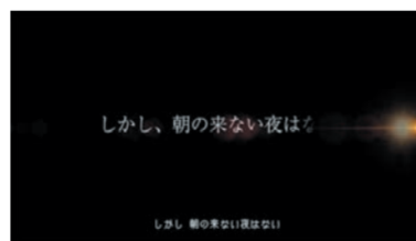
しかし、朝の来ない夜はない!