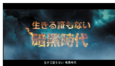
生きる証もない暗黒時代