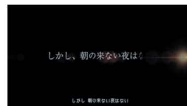
しかし、朝のこない夜はない!