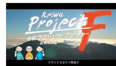
令和プロジェクトフューチャー! フライドをかけて発信す